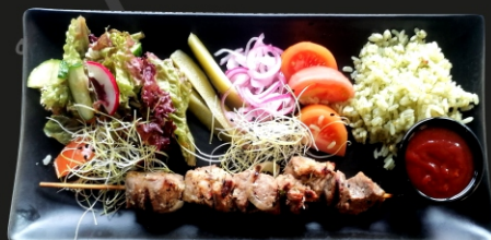
Kiaulienos sprandinė, marin. mėlynieji svogūnai, virti ryžiai, šviežių daržovių garnyras, pomidorai, alaus bbq padažas.

* Garnyras pasirinktinai - bulvių piurė, gruzdintos bulvytės, gruzdintos bulvių skiltelės, ryžiai Daržovės - grilintos daržovės, šviežios daržovės Padažus galima keisti