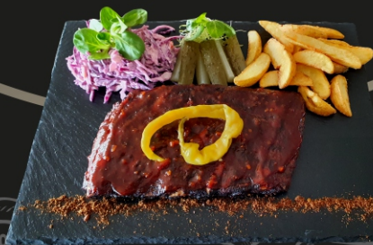
Lėtai gaminti kiaulienos šonkauliai, marinuoti agurkai, bulvių skiltelės, šviežių kopūstų salotos, BBQ padažas.