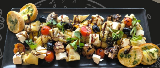
Grilintos daržovės su fetos sūriu