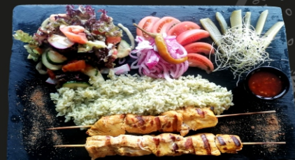
Vištienos filė, virti ryžiai, pomidorai, saldziarūgštis aitriųjų paprikų padažas, šviežių daržovių garnyras.